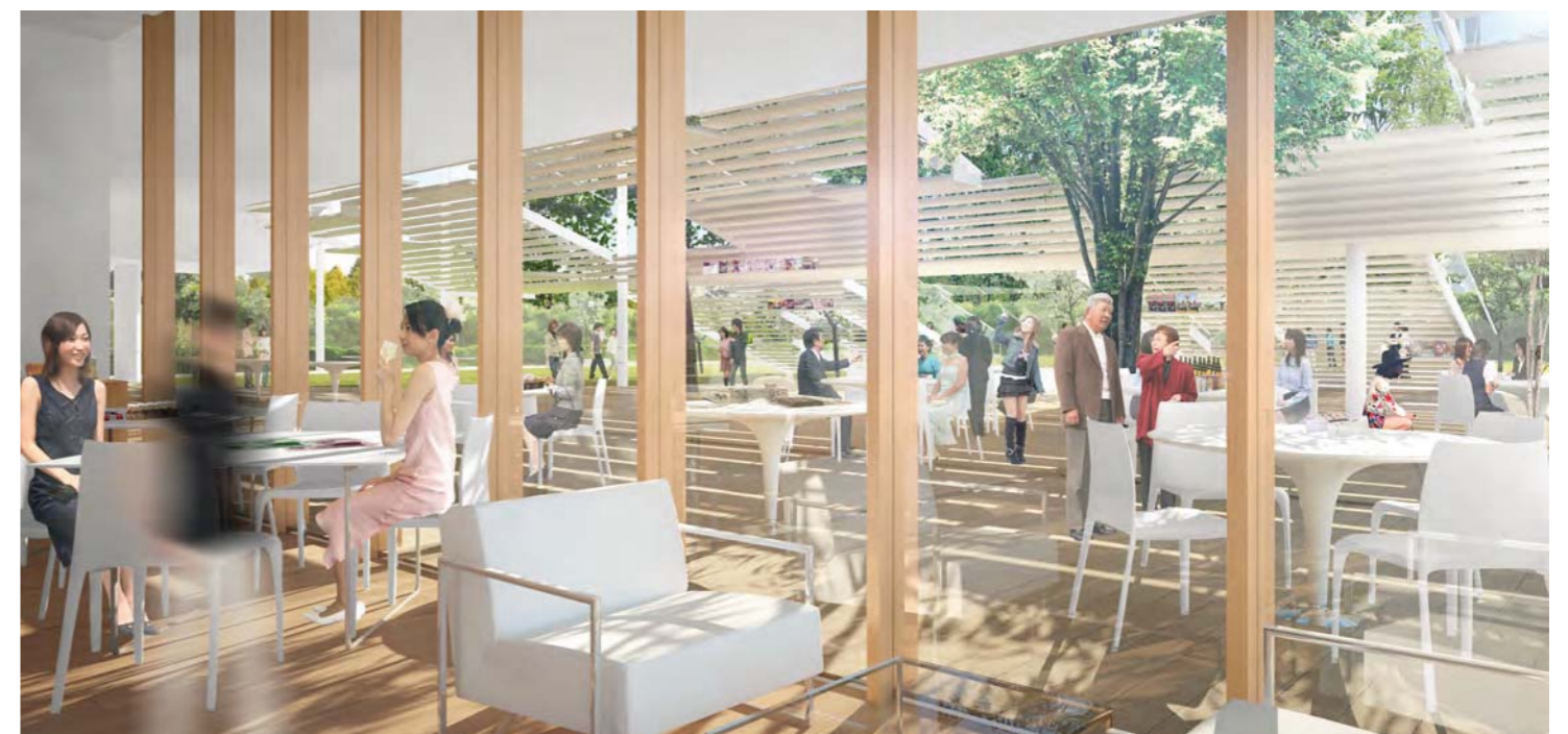
健康増進公園との一体利用が可能な中間領域