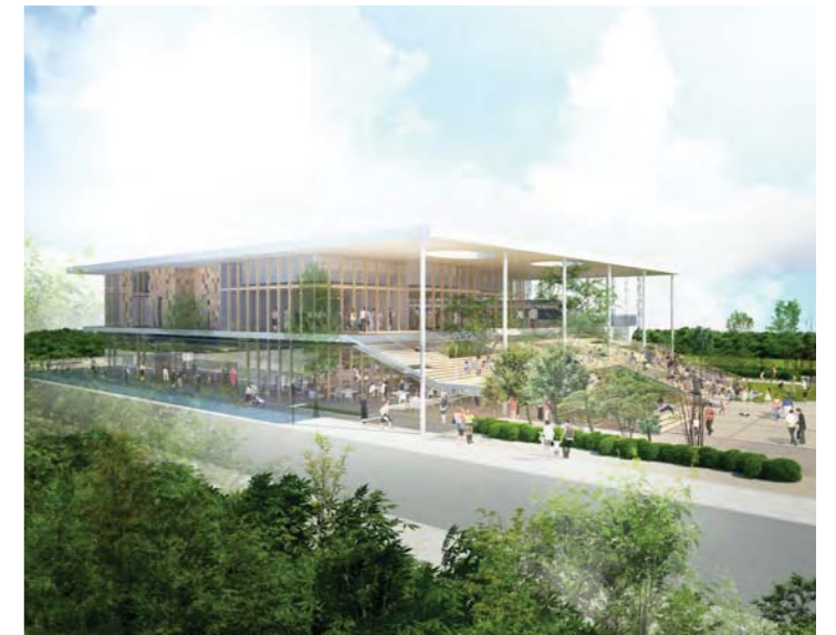
健康増進公園と一体化した緑豊かににぎわいを生み出す外観デザイン