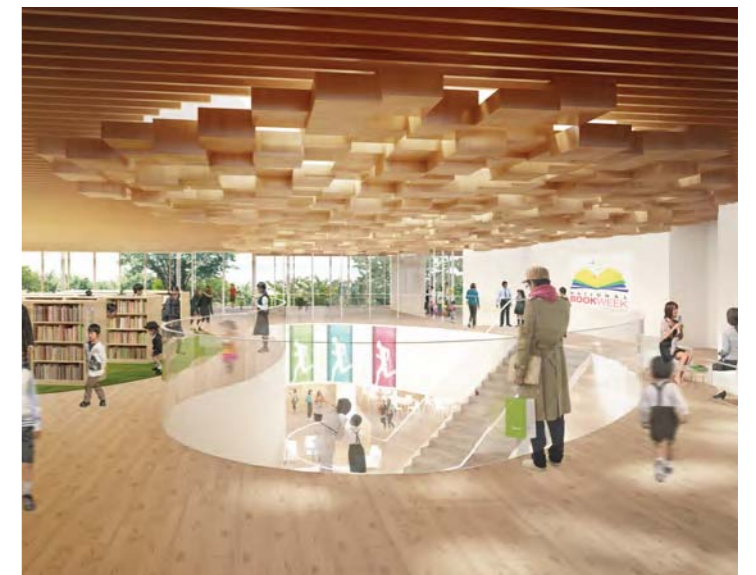
市民のさまざまな活動があふれる吹抜け