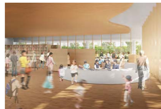
さまざまな健康へのアプローチが可能な健康ゾーン